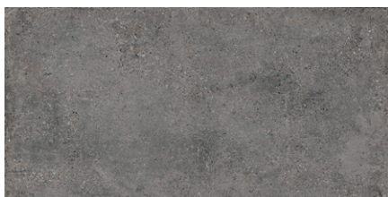
LANDSCAPE Graphit** | Farb-Nr. 093 | IV | R10/B

EXTRUDIERTES STEINZEUG vereint die Kraft von Erde, Wasser, Luft und Feuer. Durch ein spezielles Herstellungsverfahren entsteht eine feine Mikrostruktur in der Fliese, wodurch ein besonders robustes und äußerst langlebiges Produkt entsteht. So lassen sich auch Anwendungen in Außenbereichen sicher realisieren.