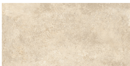
LANDSCAPE Sand | Farb-Nr. 090 | IV | R10/B