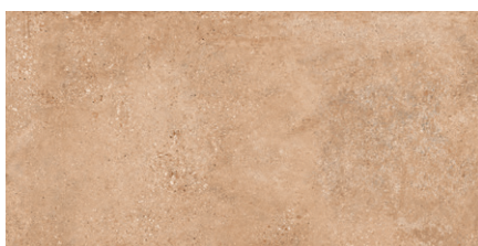
LANDSCAPE Cotto | Farb-Nr. 091 | IV | R10/B