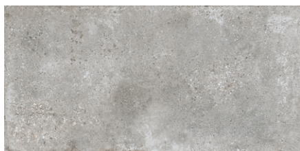
LANDSCAPE Kiesel | Farb-Nr. 092 | IV | R10/B